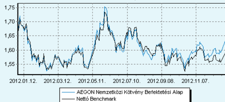
EGY JEGYRE JUTÓ NETTÓ ESZKÖZÉRTÉK, 2012.01.01 - 2012.12.31

Az alapok múltbéli teljesítménye nem nyújt garanciát a jövőbeli hozamok nagyságára. Jelen hirdetés nem minősül ajánlattételnek vagy befektetési tanácsadásnak. A befektetés részletes feltételeit az Alap Tájékoztatója tartalmazza, mely a mindenkor érvényes kondíciós listákkal együtt megtalálható a forgalmazási helyeken. A befektetési alap forgalmazásával (vétel, tartás, eladás) kapcsolatos költségek az alap kezelési szabályzatában és a forgalmazási helyeken megismerhetők.