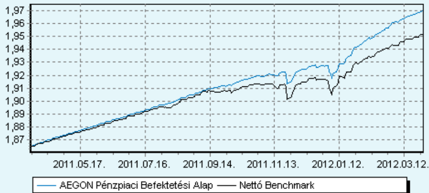
EGY JEGYRE JUTÓ NETTÓ ESZKÖZÉRTÉK, 2011.04.01 - 2012.03.31

Az alapok múltbeli teljesítménye nem nyújt garanciát a jövőbeli hozamok nagyságára. Jelen hirdetés nem minősül ajánlattételnek vagy befektetési tanácsadásnak. A befektetés részletes feltételeit az Alap Tájékoztatója tartalmazza, mely a mindenkor érvényes kondíciós listákkal együtt megtalálható a forgalmazási helyeken. A befektetési alap forgalmazásával (vétel, tartás, eladás) kapcsolatos költségek az alap kezelési szabályzatában és a forgalmazási helyeken megismerhetők.