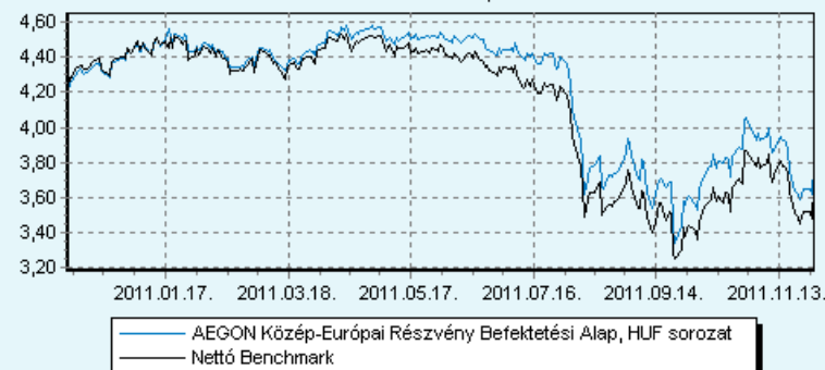
EGY JEGYRE JUTÓ NETTÓ ESZKÖZÉRTÉK, 2010.12.01 - 2011.11.30

Az alapok múltbeli teljesítménye nem nyújt garanciát a jövőbeli hozamok nagyságára. Jelen hirdetés nem minősül ajánlattételnek vagy befektetési tanácsadásnak. A befektetés részletes feltételeit az Alap Tájékoztatója tartalmazza, mely a mindenkor érvényes kondíciós listákkal együtt megtalálható a forgalmazási helyeken. A befektetési alap forgalmazásával (vétel, tartás, eladás) kapcsolatos költségek az alap kezelési szabályzatában és a forgalmazási helyeken megismerhetők.